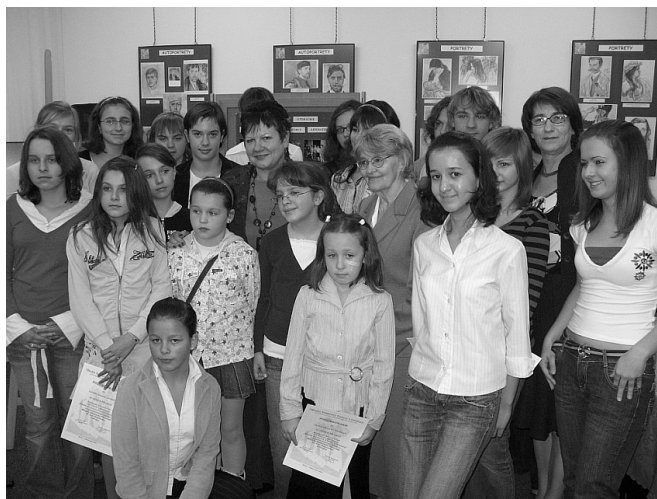
Uczestnicy i jurorzy poprzedniego konkursu literackiego